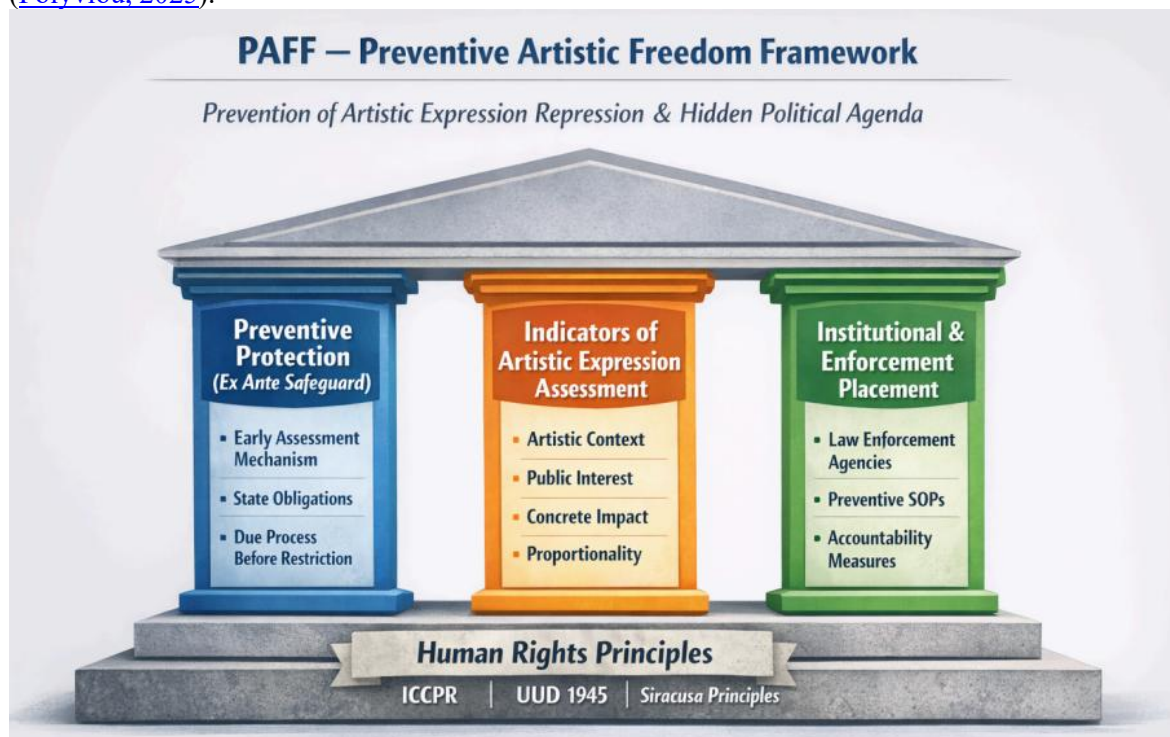
Gambar 1. Kerangka PAFF untuk Perlindungan Kebebasan Seni

penindakan, bukan pada penyaringan awal yang berbasis prinsip HAM. Dalam konteks ini, diperlukan suatu rekonstruksi konseptual yang mampu menggeser paradigma dari pendekatan represif ex post menuju perlindungan preventif ex ante . Atas dasar kebutuhan tersebut, bagaimana kemudian penelitian ini merumuskan Preventive Artistic Freedom Framework (PAFF) sebagai model normatif yang terstruktur dan berlapis untuk menjamin bahwa pembatasan terhadap ekspresi seni dilakukan secara rasional, terukur, dan selaras dengan prinsip negara hukum demokratis (Polyviou, 2025).